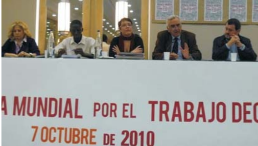
Ponentes de la III JMMD.

El sindicato ha llevado a cabo diversas actividades con motivo de la Tercera Jornada Mundial por el Trabajo Decente. Cada 7 de octubre y como resultado del mandato de la CSI desde su constitución en Viena, los trabajadores y trabajadoras, junto a sus sindicatos, reclamamos este día la universalización de derechos laborales y libertades, el empleo, la protección social y el diálogo social.