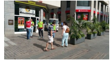
Sucursal de Bankia en Santa Cruz.

La Federación de Trabajadores de Seguridad Privada ( FTSP-USO ) continúa con su campaña contra las empresas pirata, denunciando las malas prácticas llevadas a cabo por las empresas del sector.