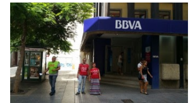
Sucursal de BBVA en Tenerife.

Asimismo, el pasado día 21 de agosto se procedió en Las Palmas de Gran Canaria, a una pegada de carteles, así como a la entrega de panfletos a cuantas personas pasaban por las inmediaciones de las puertas de las sucursales de BBVA y en el Cabildo de Gran Canaria, que tienen contratada a la empresa pirata, Seguridad Integral Canaria.